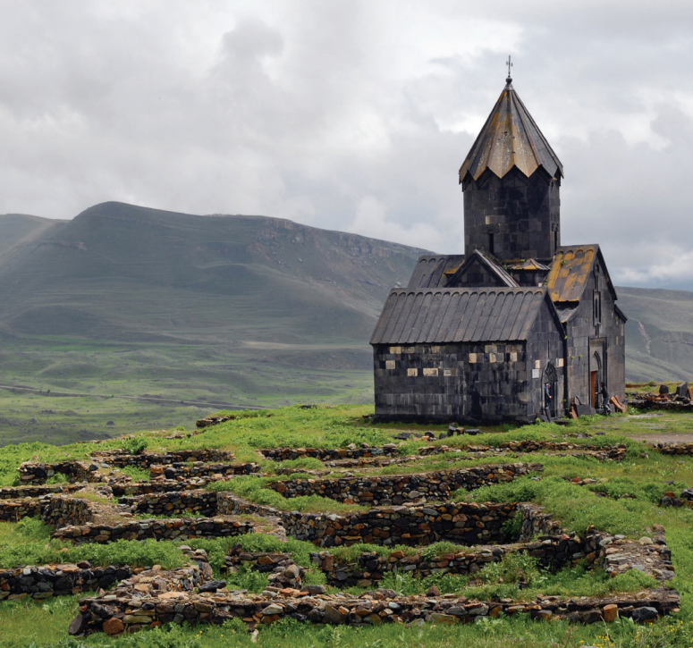
Քաղաքակրթության օրրան. հնագույն մշակութային և պատմական գանձերը վկայում են Հայաստանի բնակեցման երկար պատմության մասին