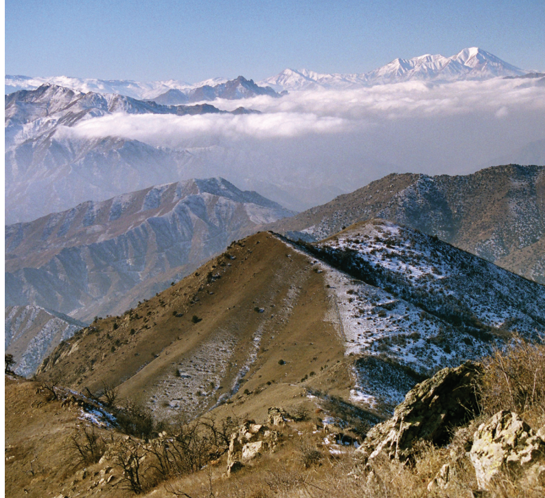
Հայաստանի Լեռնային բնապատկերների վայրի գեղեցկությունը